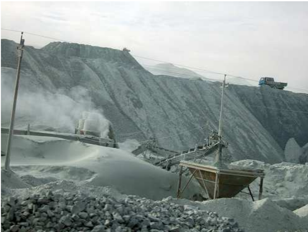
Mina de amianto en Shimiankuang (China)

Rusia y China también son líderes en la producción y consumo de materiales con amianto. En China, la mina más importante, que ha recibido premios de calidad por parte de las autoridades, es un campo de trabajo para presos (pdf) .